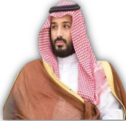
صاحب السمو الملكي الأمير محمد بن سلمان بن عبد العزيز آل سعود ولي العهد رئيس مجلس الوزراء