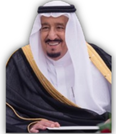
خادم الحرمين الشريفين الملك سلمان بن عبد العزيز آل سعود