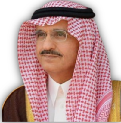
صاحب السمو الملكي الأمير خالد بن بندر آل سعود الرئيس الفخري للجمعية